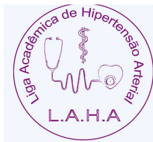
Liga Acadêmica de Hipertensão Arterial

Atualmente, a Hipertensão Arterial Sistêmica (HAS) é um problema de saúde pública, uma vez atinge cerca de 30% da população brasileira e acarreta elevados custos médicos e socioeconômicos devido às suas complicações (acidente vascular cerebral, doenças coronarianas, insuficiência renal crônica, entre outras). Essas consequências podem ser evitadas, desde que os hipertensos conheçam sua condição e mantenham-se em tratamento.