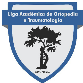
Liga Acadêmica de Ortopedia e Traumatologia

XXXXXXXXXXXXXXXXXXXXXXXXXXXXXXXXXXXXXXXXXXXXXXXXXXXXXXXXXXXXXXXXXXXX