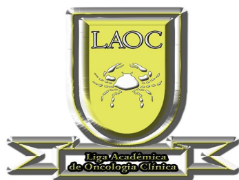
Liga de Oncologia Clínica

A estrutura física disponibilizada pela faculdade também facilita o andamento do projeto, onde podemos acompanhar os atendimentos cardiológicos no Núcleo de Atenção à Saúde e de Práticas Profissionalizantes – NASPP, além da liga acompanhar atendimentos no hospital Santa Casa de Montes Claros. Cada integrante da liga deve acompanhar semanalmente um ambulatório onde pacientes hipertensos em acompanhamento pela Liga são atendidos. A assiduidade é condição primordial para a permanência do acadêmico na Liga.